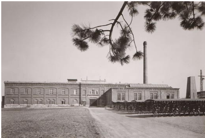
Kolb und Schüle, Werk um 1930

Letzten Endes aber eröffnete die Industrialisierung und damit die Perspektive neuer Einkunfts- und Beschäftigungsmöglichkeiten den Ausweg aus der Falle, die sich aus zunehmender Bevölkerung – man muss sich klar machen, dass Nabern in der Jahrhundertmitte eine Spitze der Einwohnerzahlen erreichte, die bis zum Zweiten Weltkrieg nicht mehr übertroffen wurde – und dementsprechend knapperen Ressourcen ergeben hatte. Obwohl Nabern bis in die 1950er Jahre ein von der Landwirtschaft geprägter Ort blieb, änderte sich auch hier mit Gründung der Industriebetriebe entlang der Lauter einiges. Die Filialgründung der Kirchheimer Baumwollweberei Kolb und Schüle 1897 in Bissingen gab vielen eine Beschäftigung.